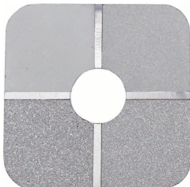
グリットブラスト用