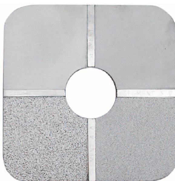
ショットブラスト用

グリットブラスト及びショットブラストで処理された金属表面の粗さを評価するために使用します。比較板は粗さの違う4段階に分かれており、比較板中央の孔から検査対象面の粗さがどの粗さにあるかを目視もしくはルーペで確認しブラスト粗さを評価します。ISO8503-1及びJIS-Z0313に規定されたブラスト面の評価方法に用います。比較板にはグリットブラスト用(G)とショットブラスト用(S)があります。グリットブラスト用の表面粗さ25、60、100、150 \mu\text{m} ・ショットブラスト用表面粗さ25、40、70、100 \mu\text{m} 。