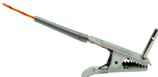
クランプ雰囲気温度プローブ