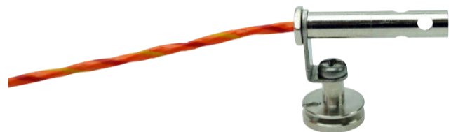
マグネット雰囲気温度プローブ