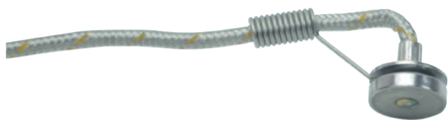
高温マグネット製品温度プローブ