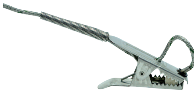
高温クランプ製品温度プローブ